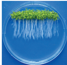
Рис. 1. Внешний вид проростков A. thaliana (L.) Heynh. различных генотипов, выращенных из семян в стерильной культуре на гелевой среде:

a – WS-0; б – gork1-1 ; в – Col-0; г – almt1