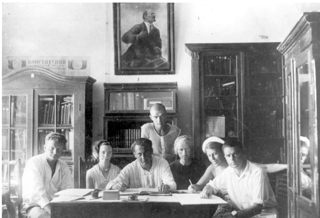
Мал. 5. Студэнты гістарычнага факультэта БДУ ў бібліятэцы Херсанескага гістарычна-археалагічнага музея (1939).