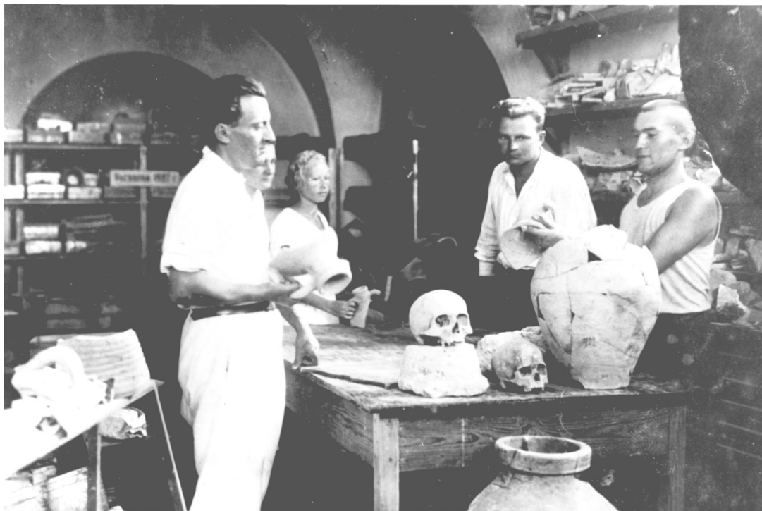
Мал. 4. Студэнты гістарычнага факультэта БДУ ў фондасховішчы Херсанескага гістарычна-археалагічнага музея (1939).