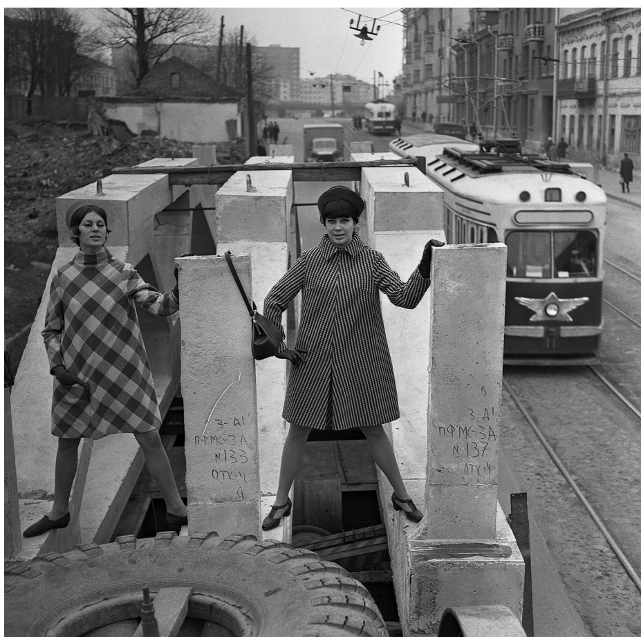
Ю. Іваноў. Манекеншчыцы Мінскага дома мадэляў. 1966. Ju. Ivanow. Models of Minsk fashion house. 1966.