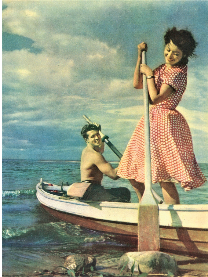
А. Дзітлаў. Фотаэцюд «На прастор». A. Dzitlaq. Photo study «To the vastness».