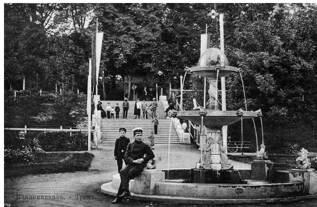
Рис. 7. Владикавказ. Фонтан и лестница в Ерофеевском парке «Трек». Фотография. 1910.

Обновление состава было связано прежде всего с выпусками из кадетского корпуса. Так, 74-й выпуск кадет, состоявшийся 26 мая 1914 г., насчитывал 59 человек. Из них были переведены в военные училища 48 воспитанников: в Николаевское инженерное училище 1 человек, в Павловское пехотное училище 8 чело-