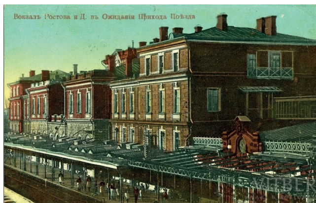
Рис. 8. Вокзал Ростова-на-Дону в ожидании поезда.