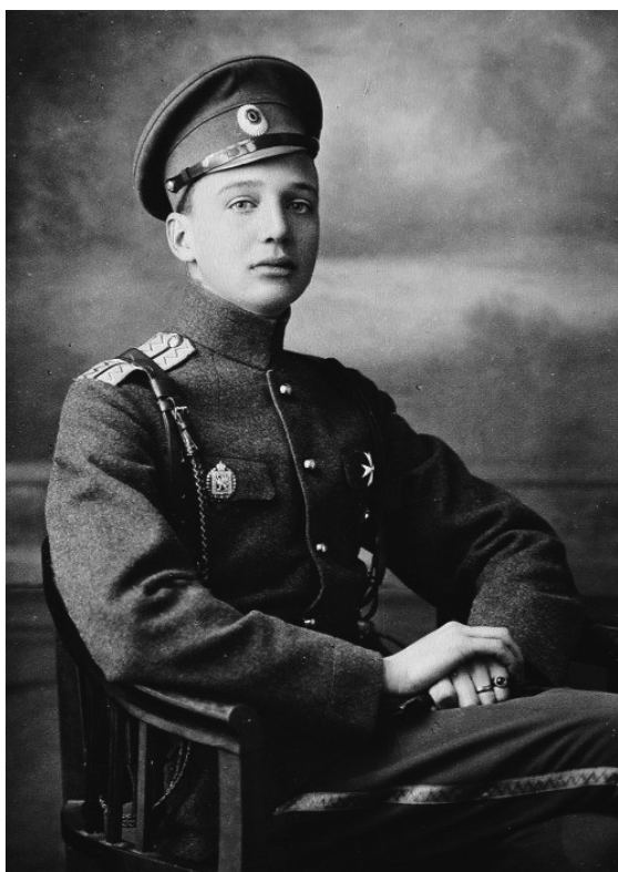
Рис. 5. Князь императорской крови Олег Константинович (Романов). Фотография. 1914.

Fig. 4. Odessa Cadet Corps. Postcard. Beginning of the 20 th century.