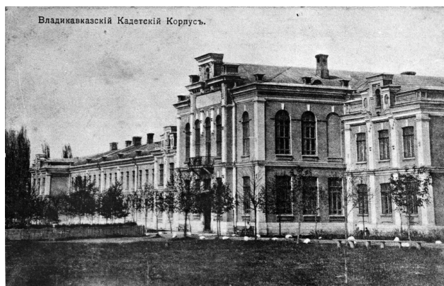
Рис. 6. Владикавказский кадетский корпус. Открытка. Начало XX в.

Директору (с 15 марта 1915 г.) Владикавказского кадетского корпуса генерал-майору В. В. Троцкому-Сенютовичу 84 пришлось приложить немало усилий для того, чтобы уладить эту ситуацию, од-