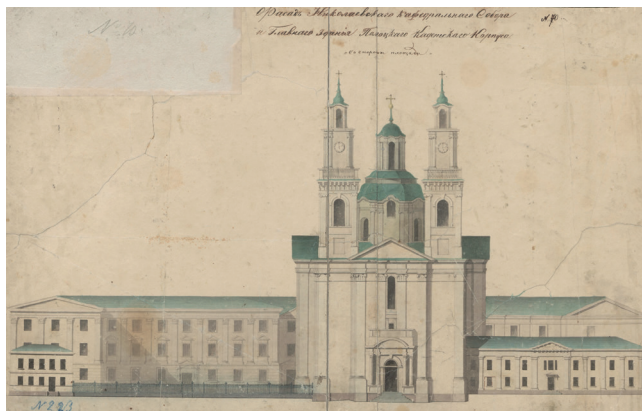
Рис. 2. Фасад Николаевского кафедрального собора и главного здания Полоцкого кадетского корпуса. Рисунок Д. М. Струкова. 1864–1867.

Fig. 1. Polotsk. Nicholas Cathedral from the left bank of the Western Dvina river. Photo by S. M. Prokudin-Gorsky. 1912. Source: https://www.loc.gov