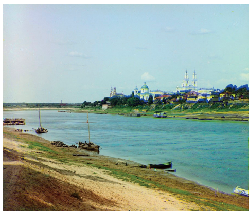
Рис. 1. Полоцк. Николаевский собор с левого берега р. Западная Двина. Фотография С. М. Прокудина-Горского. 1912. Источник: https://www.loc.gov

Fig. 1. Polotsk. Nicholas Cathedral from the left bank of the Western Dvina river. Photo by S. M. Prokudin-Gorsky. 1912. Source: https://www.loc.gov