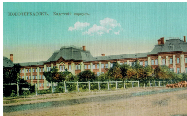
Рис. 9. Новочеркасск. Донской императора Александра III кадетский корпус. Открытка. Начало XX в. Fig. 9. Novocherkassk. Don emperor Alexander III Cadet Corps. Postcard. Beginning of the 20 th century.