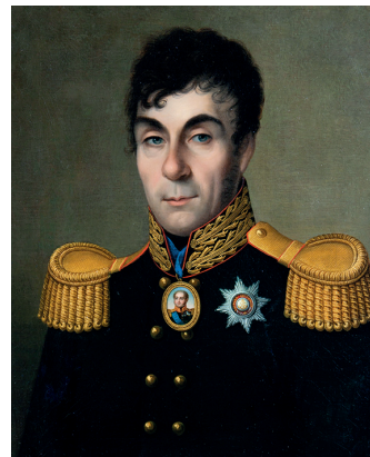
Рис. 3. Граф Алексей Андреевич Аракчеев. Портрет работы неизвестного художника. Масло. 1830-е гг. Государственный исторический музей (Москва) Fig. 3. Count Aleksei Andreevich Arakcheev. Portrait by an unknown artist. Oil. 1830s. State Historical Museum (Moscow)