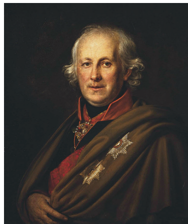
Рис. 8. Адмирал Николай Семенович Мордвинов. Портрет работы А. Г. Варнека. Масло. Конец 1810-х – начало 1820-х гг. Государственный Эрмитаж (Санкт-Петербург) Fig. 8. Admiral Nikolai Semenovich Mordvinov. Portrait by A. G. Varnek. Oil. Late 1810s – early 1820s. State Hermitage Museum (Saint Petersburg)

Дело Провиантского департамента получило широкий резонанс и имело последствия не только для подсудимых. Так, 2 апреля 1823 г., учитывая сильное общественное давление, министр юстиции князь