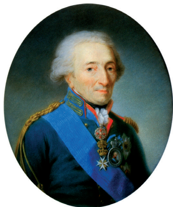
Рис. 2. Граф (с 1814 г. светлейший князь) Николай Иванович Салтыков. Портрет работы М. Ф. Квадаля. Масло. 1807. Государственный Эрмитаж (Санкт-Петербург) Fig. 2. Count (since 1814, His Serene Highness Prince) Nikolai Ivanovich Saltykov. Portrait by M. F. Kvadal'. Oil. 1807. State Hermitage Museum (Saint Petersburg)

Опасаясь гнева монарха, в Провиантском департаменте решили переложить ответственность за свои злоупотребления на бывшего витебского гражданского губернатора. Как впоследствии писал К. К. Лешерн в пояснительной записке Александру I, Провиантский департамент «...предпринял изыскивать средства к очернению дел его, называя оные запутанными и столь невыгодными для казны, что насчитал убытка на немалотысячную сумму. Сим способом хотел он прикрыть дорогую свою покупку и продолжать дело» 46 .