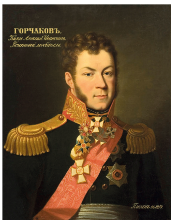
Рис. 1. Князь Алексей Иванович Горчаков. Портрет работы неизвестного художника.

После оставления Белорусско-Литовского края порядок обеспечения российских войск определялся повелением Александра I от 31 июля 1812 г. управляющему Военным министерством Российской империи (далее – Военное министерство) князю А. И. Горчакову (рис. 1). В документе указывалось, что в ответственности министерства остаются «внутренние распоряжения о продовольствии всех войск, не входящих в состав Большой действующей армии» 22 . Таким образом, в течение кампании 1812 г. на Военное министерство возлагалось только обеспечение формируемых резервов 23 [3].