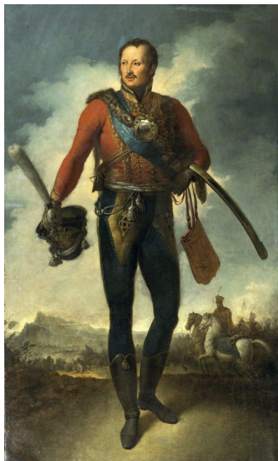
Рис. 4. Граф (с 1834 г. – светлейший князь) Петр Христианович Витгенштейн. Портрет работы неизвестного художника. Масло. 1813–1815. Государственный исторический музей (Москва) Fig. 4. Count (since 1834, His Serene Highness Prince) Petr Khristianovich Vitgenstein. Portrait by an unknown artist. Oil. 1813–1815. State Historical Museum (Moscow)