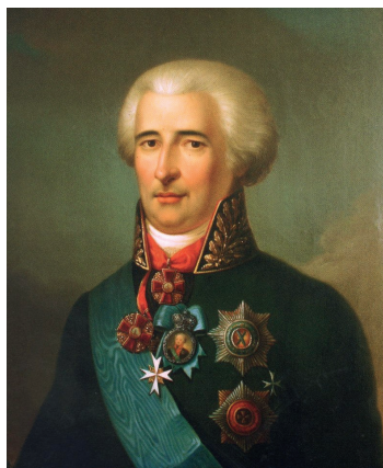
Рис. 7. Светлейший князь Петр Васильевич Лопухин. Портрет работы неизвестного художника. Масло. Первая половина XIX в. Государственный музей-заповедник «Павловск» (Санкт-Петербург)