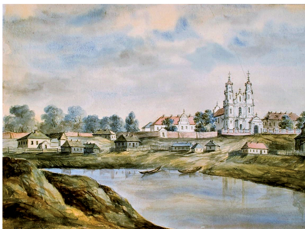
Рис. 5. Вид на м. Волинцы со стороны р. Дриссы. Костел и монастырь доминиканцев. Рисунок Н. Орды. Карандаш, акварель, гуашь, сепия. 1875–1876. Источник: [11, с. 185] Fig. 5. Volyntsy from the side of the Drissa River. Church and the Dominican monastery. Painting by N. Orda. 1875–1876. Source: [11, p. 185]