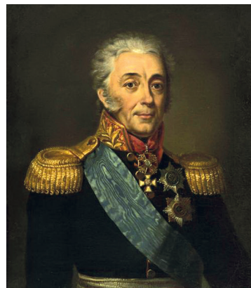
Рис. 6. Князь Дмитрий Иванович Лобанов-Ростовский. Портрет работы неизвестного художника. Масло. 1820-е гг. Русский музей (Санкт-Петербург)

В состав особой следственной комиссии 8 января 1817 г. 86 были включены член Государственного совета князь Д. И. Лобанов-Ростовский (в качестве председателя) (рис. 6), сенатор князь Н. Л. Шаховской (в 1805–1807 гг. – генерал-провиантмейстер армии) и бывший обер-прокурор И. С. Булычев. Комиссия должна была незамедлительно приступить к работе, в течение шести месяцев «рассмотреть все действия внутреннего Провиантского ведомства» за 1813–1817 гг. и «открыть извороты злоупотреблений, произведших великий общественный вред» 87 .