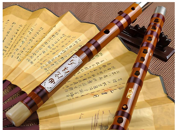
Рис. 1. Ди.

Ди – китайская поперечная флейта с шестью отверстиями (рис. 1). Чаще всего она изготавливается из бамбука или тростника, но можно встретить варианты из других пород дерева и даже из камня (нефрита). Вблизи закрытого конца ствола находится отверстие, прикрытое тончайшей камышовой или тростниковой пленкой. Ди обладает «сочным» звучанием, которое обусловлено резонированием этой пленки.