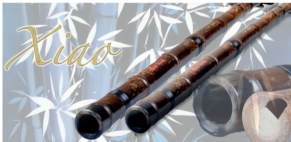
Рис. 5. Сяо.

можно играть только монофонические мелодии. Репертуар сяо в основном состоит из классической и традиционной музыки, что делает ее популярной среди молодежи относительно низкой. Во-вторых, играть на сяо тяжело, так как необходимы контроль дыхания и умение настраивать мундштук. Кроме того, существует нехватка учителей игры на сяо, что затрудняет процесс обучения. В-третьих, популярность сяо за пределами Китая ограничена. Она менее известна, чем, например, гучжэн, поэтому игре на ней обучается небольшое количество людей. В-четвертых, сяо имеет скромный внешний вид, на ней мало украшений, что делает этот инструмент менее привлекательным для новичков. В-пятых, учебных ресурсов и рекомендаций по игре на сяо очень мало. Многие учебные заведения не включают ее в свои программы, что ограничивает возможность обучения [6].