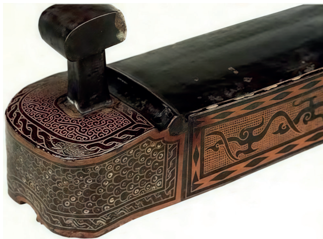
Рис. 4. Чжу.

Сяо – традиционная китайская продольная бамбуковая флейта с закрытым нижним концом (рис. 5). Она считается одним из старейших музыкальных инструментов в мире (7 тыс. лет). Ее изготавливали из кости. Вплоть до времен династии Тан сяо, а также пайсяо (многоствольная флейта) имели общее название «сяо», а любые поперечные одноствольные флейты назывались «ди». К XII в. название «сяо» закрепилось только за продольной флейтой, которую делали из бамбука или фарфора. Музыкальный интервал сяо составлял около двух октав, она использовалась как сольный и ансамблевый инструмент. До наших дней сохранились немногочисленные экземпляры флейты XVI–XVII вв. и достаточно большое количество экземпляров XIX в. Причин, по которым сяо утратила свою популярность в современном Китае, было несколько. Во-первых, выбор музыкального репертуара ограничен, так как на сяо