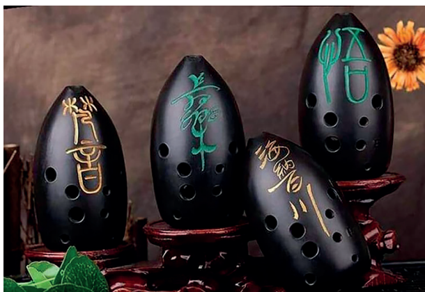
Рис. 2. Сюнь.