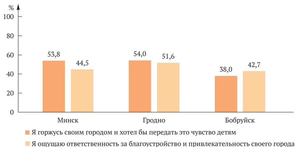
Рис. 1. Отношение респондентов к своему городу в зависимости от места проживания Fig. 1. Attitude of respondents towards your city depending on the place of residence

В свою очередь, жители Бобруйска значительно чаще проявляли желание участвовать в дворовых праздниках вместе с соседями (рис. 2), а также демонстрировали более высокий уровень доверия по отношению к соседям и готовности прийти к ним на помощь (см. табл. 1).